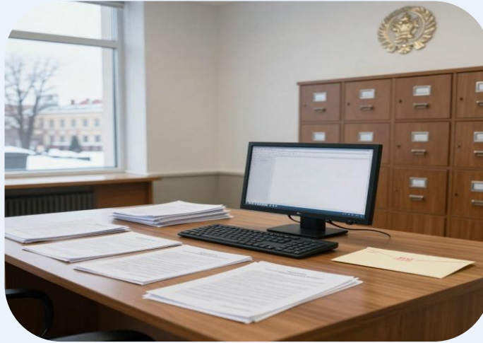
Борьба с теневой экономикой и финансовыми нарушениями

Рационализация коммуникаций способствует снижению бюрократических барьеров и ускоряет обработку информации, поддерживая комфортные условия для плательщиков.