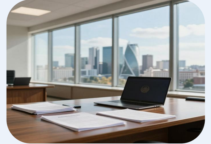
Повышение доверия и прозрачности

Активное выявление и пресечение незаконной деятельности укрепляет доверие к налоговой системе и способствует увеличению собираемости законных налоговых платежей.