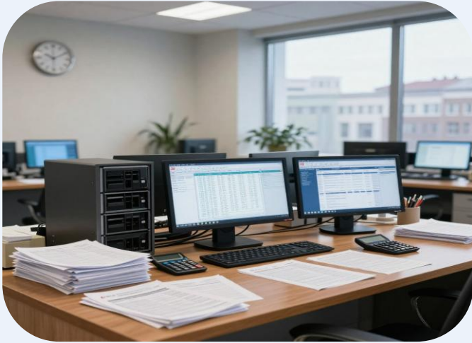
Упрощение взаимодействия налогоплательщиков и налоговых органов

Рационализация коммуникаций способствует снижению бюрократических барьеров и ускоряет обработку информации, поддерживая комфортные условия для плательщиков.