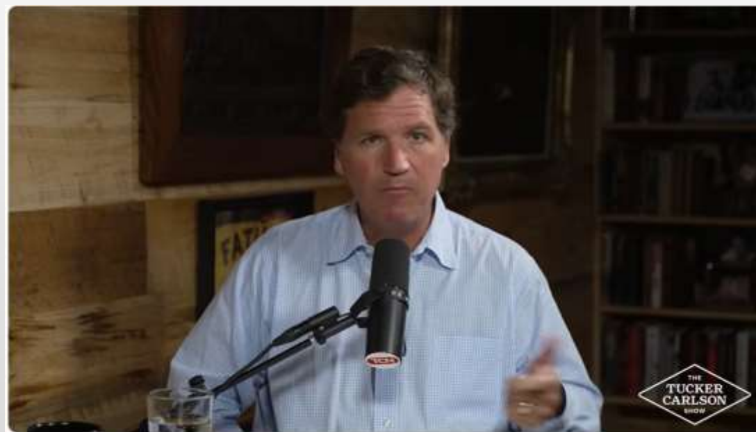
Trump Announces the End of Global American Empire. Here's What Comes Next.