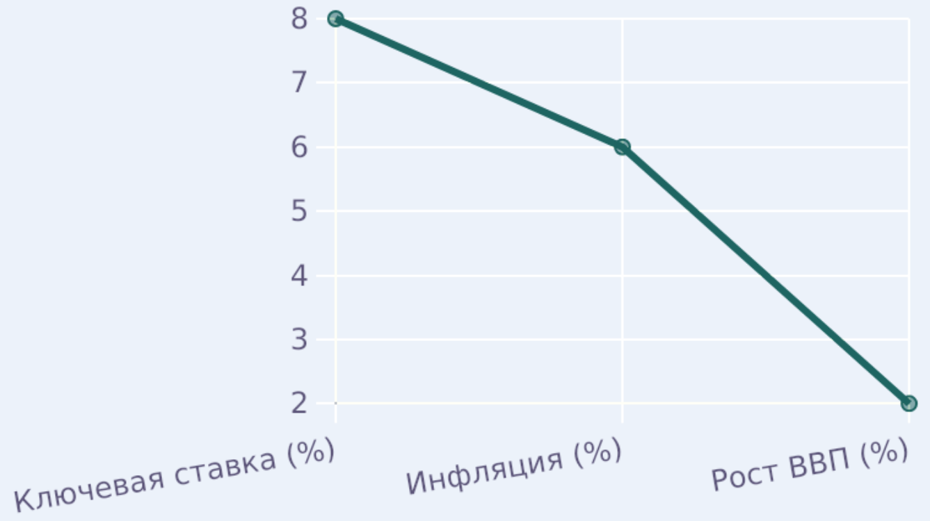
Динамика ключевой ставки, инфляции и ВВП (2010 – 2023)

Повышение ставок эффективно снижает инфляцию, но тормозит рост ВВП и может привести к стагнации.