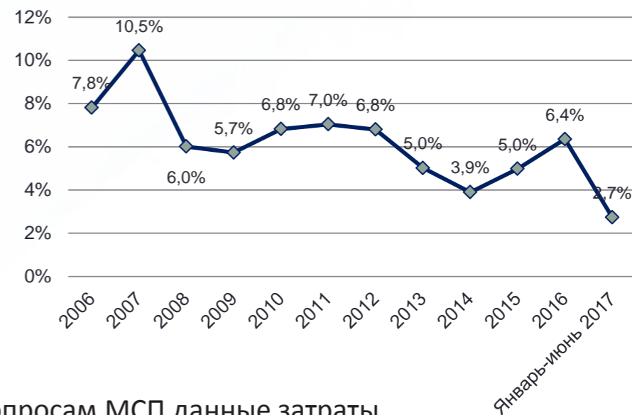
Рентабельность активов российских организаций, %