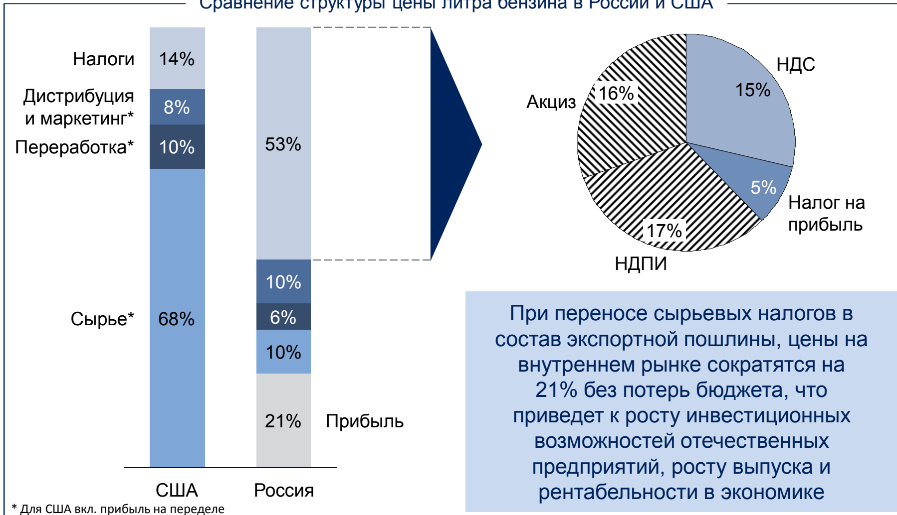
Сравнение структуры цены литра бензина в России и США

При переносе сырьевых налогов в состав экспортной пошлины, цены на внутреннем рынке сократятся на 21% без потерь бюджета, что приведет к росту инвестиционных возможностей отечественных предприятий, росту выпуска и рентабельности в экономике